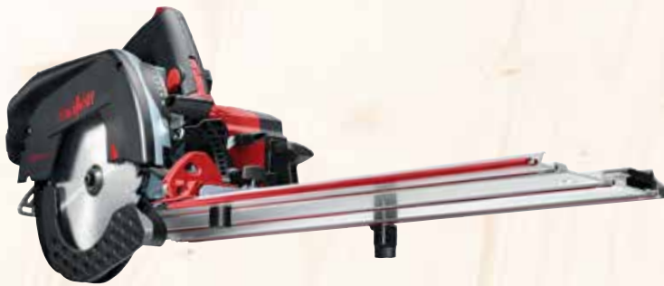
Kappschiene-Säge KSS 50 cc im Transportkoffer Art.Nr.: 918902