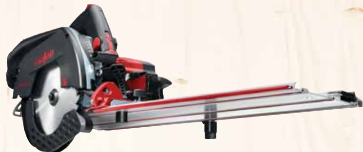
Kappschiene-Säge KSS 50 cc Art.Nr.: 918901